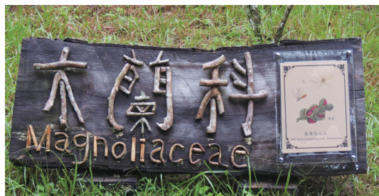
木蘭科植物展示區。

意象。製作的過程完全依靠本所員工、人力搬運那些枯木斷枝，大型的枯木往往需要4、5人才能搬的動，透過專業藝術家的指導、擺設，讓這些原本在森林裡腐化的木頭，蛻變成讓人讚嘆的藝術品。