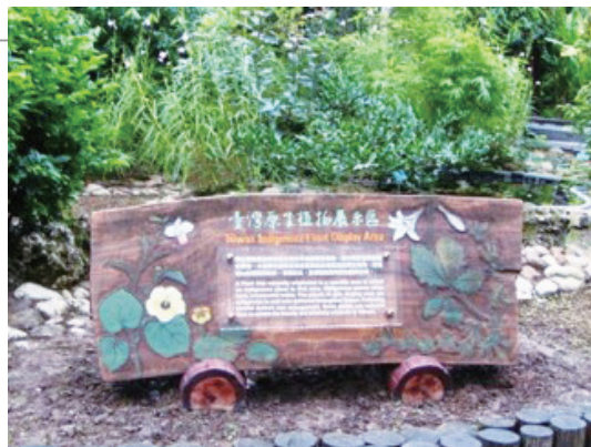
以黃連木段木製作的原生植物展示解說牌。

枯立倒木作為在福山植物園的入口意象：福山植物園一群山環繞，除了因應植物保育、教育所蒐集的原生植物，週遭都是未遭破壞、干擾的天然林，每年的颱風都會造成不同程度損害，風折、風倒致使很多樹木死亡。民國102年邀請裝置藝術家陳錦文老師、坪林國中莊苑清老師利用區颱風枯倒木及原生植物作為福山植物園藝術圍籬和入口