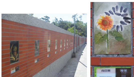
臺北植物園延平南路入口種實圍牆(左)。瘦果—向日葵(右)。

種實彩繪燒陶圍牆：以往臺北植物園延平南路入口圍牆破舊，常常被附近居民抗議，因此在本所民國97年與臺灣師範大學生態藝術學程楊恩生教授合作，招集該學程的學生，先由林試所植物學家呂勝由、邱文良博士傳授一些植物形態基本知識，再以植物種實為主題，挑選各類具有代表性的種實彩繪，經過多次審查修改，然後製作燒陶。因此每片陶磚都有作者簽名，是世上唯一的作品。