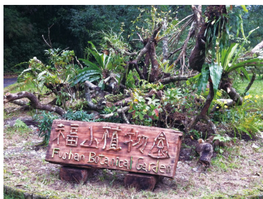
福山植物園入口意象完工圖。