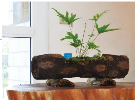
傅氏鳳尾蕨與筆筒樹蓋的盆栽。