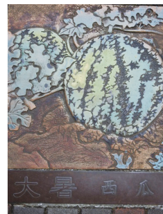
臺北植物園二十四節氣植物 “大暑—西瓜”。