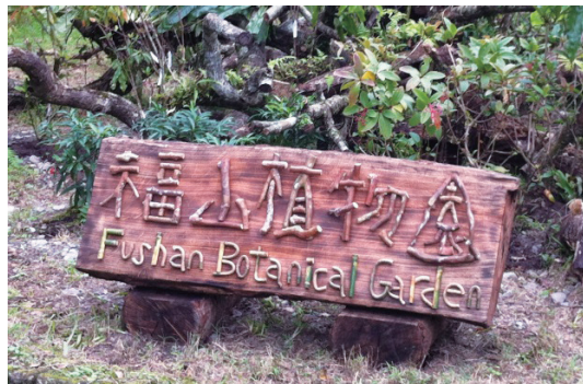
福山植物園的入口招牌。