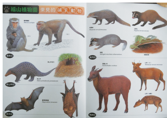
福山植物園常見野生動物摺頁。