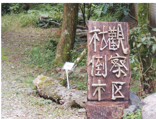
枯倒木觀察區解說牌。