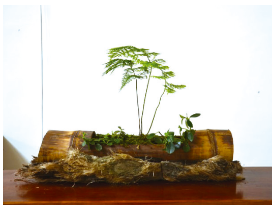
稀子蕨、椒草與苔搭配竹筒的盆栽。