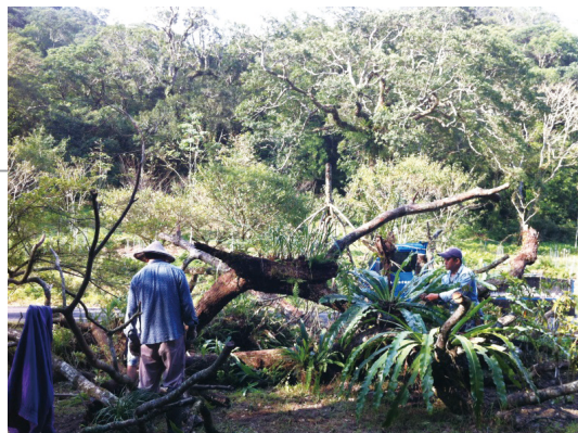
福山植物園入口意象製作施工中。