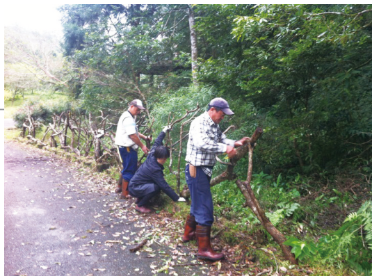
福山植物園入口圍籬製作施工中。