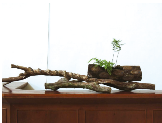
原生蕨類與筆筒樹九芎段木的組合盆栽。

“利用自然資材的生態藝術”是林試所經營、推廣植物園最重要的手段和目標，而生態藝術結合自然教育更是強化植物園存在價值的扎根做法，這也是植物園有別於一般公園的分界點。