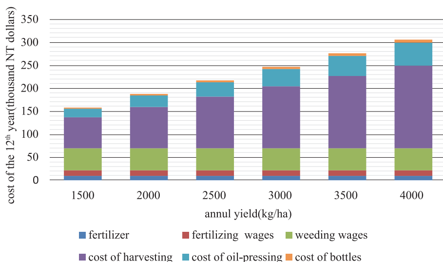
Fig. 2. Production costs of 12-yr-old Camellia brevistyla .