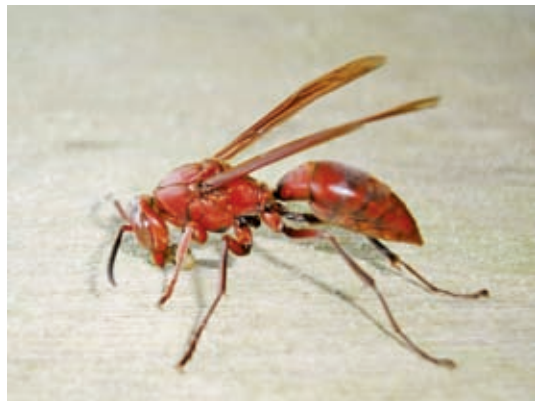
胡蜂利用強有力的大顎刮取木材纖維，再與口內分泌的液體混合成紙漿築窩

臺灣7種虎頭蜂中的黃腳虎頭蜂，即使到冬天仍可見到持續在活動，但有關黃腳虎頭蜂越冬的行為研究所知有限。作者曾於福山植物園初步觀測結果，發現當一、二月份寒流來臨時，外界溫度幾近零度時，蜂窩內部溫度仍可維持高達26-28度，虎頭蜂如何維持這種溫度耐人尋味。進一步發現當蜂窩內部溫度出現異常降低，推測此時應與停止育幼或蜂群大量離巢有關。臺北植物園內有一蜂窩也曾架設