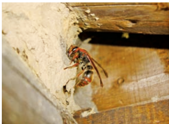
左圖為社會性胡蜂，可見親代與子代共同生活在一起，其中白色部分為幼蟲化蛹所結之繭蓋；右圖為獨棲性蜾蠃，所建造的土房子不同於社會性胡蜂的紙房子(陸聲山 攝)