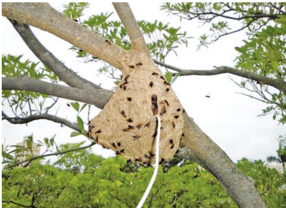
臺北植物園的虎頭蜂窩內設置溫濕度計錄器，受干擾的蜂群大量出現警戒