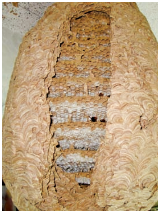
具虎斑紋路的虎頭蜂窩外殼與內部多層巢脾的結構

胡蜂蜂窩的結構變化很大，但很容易就能分辨長腳蜂與虎頭蜂蜂窩的不同。概括說來長腳蜂的蜂窩只有一層蜂室，利用一個窩柄使得蜂窩懸吊在空中，而所有的蜂便聚集在這窩上，數量多為數十隻或可達上百隻。因此，長腳蜂窩比較容易觀察，甚至可以從近距離清楚地觀察到蜂室內的卵、幼蟲及蛹的變化情形，以及成蜂的各種行為。然而虎頭蜂的蜂窩就顯