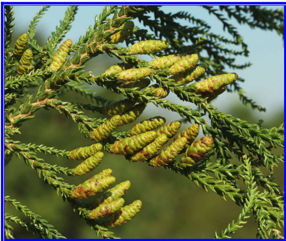
Taiwania cryptomerioides Hayata 台灣杉

行政院農業委員會林業試驗所 印行 Published by Taiwan Forestry Research Institute