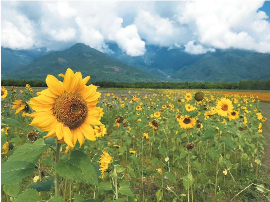
圖2 可食地景。

家長期針對兩棲類及鳥類等動物進行監測調查，累積相當豐富的基本資料，在保育及森林生態系經營上都具有貢獻。平森的志工與公民科學家有不少是當地的居民，在地民眾的參與更可增進與社會環境的連結，在地方風景的營造上是重要的一環。