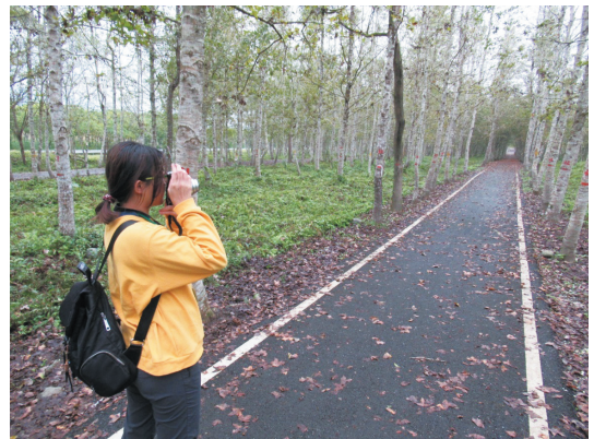
圖3 平森是公民科學家與志工的重要學習場域。

糖與設置移民村。大和工場即為花蓮糖廠的前身，雖然曾於二次大戰時遭受嚴重毀損，但戰爭後修復，並且逐漸提升設備，成為東