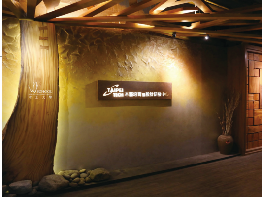
臺北科大木藝中心。