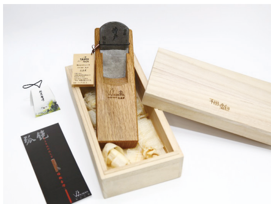
福鉋禮盒贈品。(陳殿禮 設計/攝)

關於鉋刀的創新，木藝中心將弧鉋設計成禮品，取其諧音命名「福鉋禮盒」，希望能送「福報」給收禮者。將臺灣在地材料、技藝工法重新詮釋，鉋刀從「工具」層次中解放，結合臺灣語言中的巧思，變成一種文創產品。另外還有鉋刀電子賀卡，「平鉋」報平安；「弧鉋」鉋福氣；「彎鉋」彎得好〈Wonderful〉；「翹鉋」翹得勁〈Challenge〉等都是透過創新的文化詮釋，將在地的臺灣木材以新的形式傳承鉋刀這項傳統工藝。