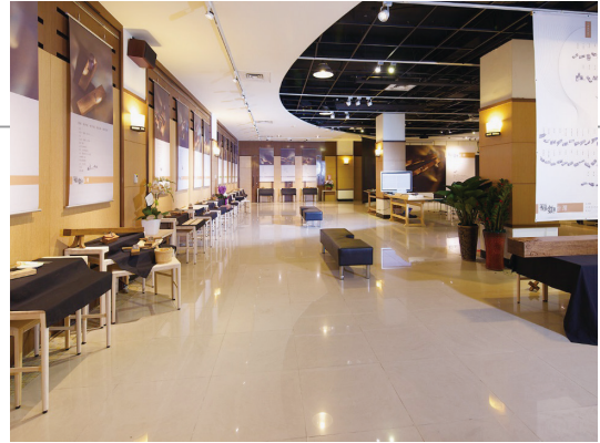
福飽臺灣展實況現場。

臺灣不同種類的材料，除了代表在地各類材料的美感外，更透過由各工坊或單位提供的臺灣材料，展示在此牆上，代表著一個單位的故事，未來更可透過QR CODE連結至設定的網址進行導覽及說明，使有限的空間高具備無限的展示內容。同時該牆面亦是教師進行材料教學最佳的展示牆，讓學生有機會實地觸摸到材料的質感，使該牆面成為了各地工坊的故事牆，讓大眾除了認識在地木材外，同時了解與木息息相關的臺灣木工藝文化。未來更可透過此一平臺，作為對國際介紹臺灣木藝發展的最佳平臺，讓具備獨特的在地故事走向國際，展現在地特殊的歷史背景。