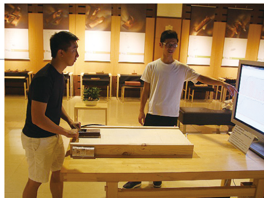
鉋刀互動體驗裝置。