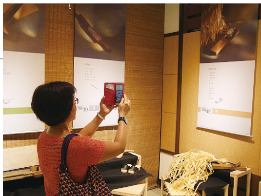
鉋刀APP程式體驗。