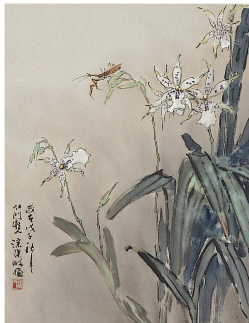
畫於溫州皮紙上的作品。(涂璨琳繪)

三、浙江產區：包括溫州、富陽、龍游等地。溫州地區周圍因是絲綢之府，桑蠶業發達，故以桑皮為造紙之主要原料，所產的紙稱「溫州皮紙」。浙江地區竹資源豐富，所產竹紙質量甚佳，有「元書紙」、「毛邊紙」等。