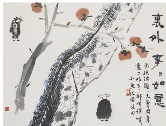
透過簡單幾筆及幾個字卻能陶冶人的性靈。(小魚 繪，徐健國 攝)

與臺灣相比，大陸成立「非物質文化遺產研究保護國家中心」，加大對傳統手工紙的保護力度。手工紙與機器紙相較，傳統手工造紙技藝具有更深的文化意涵，因此應將整個傳統造紙工藝置於非文化遺產保護框架內考量，給予政策及資金上的支持並教育宣