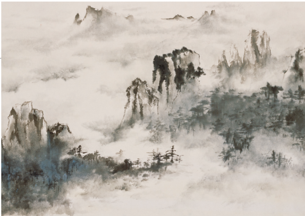
書畫家利用手工紙吸水的特性畫出渲染效果佳的水墨畫。(陳俊傑 繪，徐健國 攝)

導其稀有性，了解手工造紙與當地生活歷史的相關性，進而體認手工造紙的文化意涵，重視手工造紙技藝。或是將傳統手工造紙技藝融入當代生活，進行文化體驗旅遊，除可帶來經濟收入外，亦可進行教育及推廣活動，增加參觀者對紙張的認識，或是讓當地人主動參與傳統工藝的保護與傳承中，讓傳承與保護成為他們一種自覺行動，進而重視此傳統技藝。(金江蓮，2014)