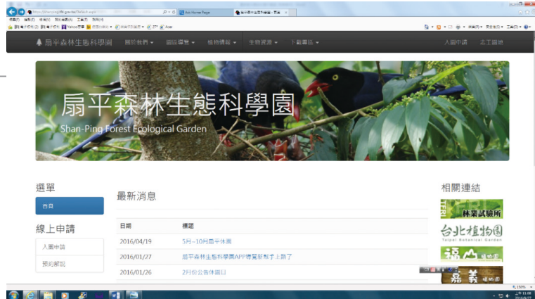
扇平新建置網站首頁。