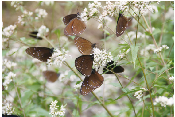
扇平展示區梅花盛開現況及紫斑蝶於高士佛澤蘭栽植區覓食狀況。