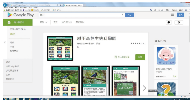
扇平園區導覽APP, google play下載畫面。