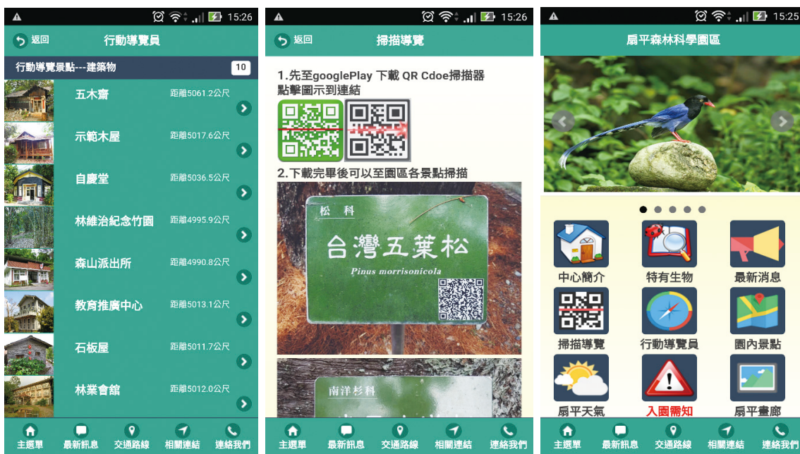
扇平APP首頁、行動導覽員頁面及掃描導覽頁面。