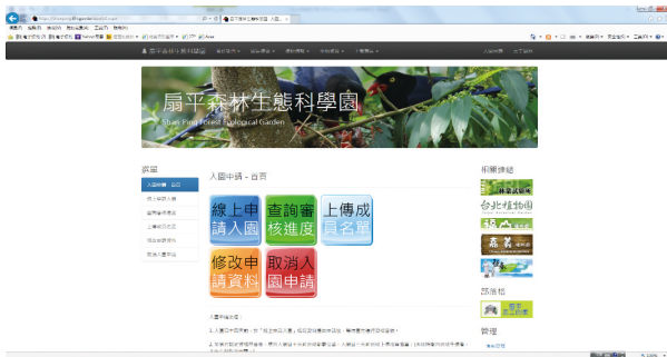
線上申請入園系統畫面。