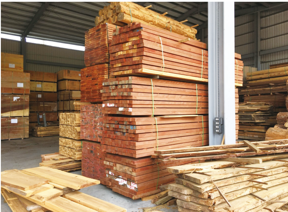
臺灣2009~2018年間總進口量最高為製材產品。

源亦暫無短缺問題，實際衛生紙生產與供應無虞。即便如此，藉由本次事件也提醒我們藉此機會檢視目前國內木質原料的供應以及進口狀況，若國內真的面臨木質原料進口來源中斷應如何因應，以及反思是否亦可將木材視為一種戰略物資，訂定臺灣每年可生產之原材產品及最低材積供緊急事件使用等。因此本文整理近10年臺灣實木產品主要進口數量以及進口國資訊，分析臺灣主要需求的產品類型、主要倚賴哪些國家之木質原料以