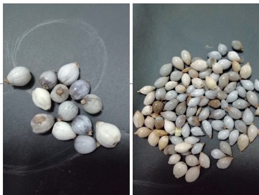
臺灣薏苡的果實(左圖，直徑約6~7 mm)較川穀的果實(右圖，直徑約3~4 mm)大，但果殼比較薄。布農族巒社群人普遍認為，用川穀果實製作的嬰兒項鍊雖然串珠較小，但品質(耐久性)比較好。