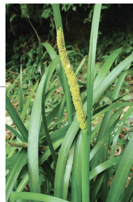
ngaan是由多年生的石菖蒲地下莖製作而成。

皆指出，上述由菖蒲地下莖製作的項鍊是掛在母親身上，並非嬰兒身上。母親會在帶嬰兒出遠門時先咬一小口項鍊上的菖蒲，放入口中咀嚼，然後將汁液塗抹嬰兒全身，口中唸祈福語、驅邪語，才會揹嬰兒出門。嬰兒生病時也會咬一小口菖蒲地下莖放入口中咀嚼後，將汁液塗抹病根處或痛處。多數耆老提到，以前部落裡的媽媽們都會掛著ngaan串的項鍊。