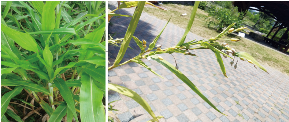
禾本科植物katipulun(臺灣薏苡)。katipulun是qehas(川穀)的變種，兩種果實都是布農族巒社群製作嬰兒項鍊的主要材料。