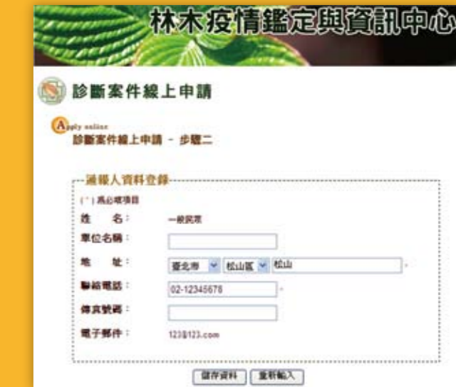
圖四 填寫申請者基本資料