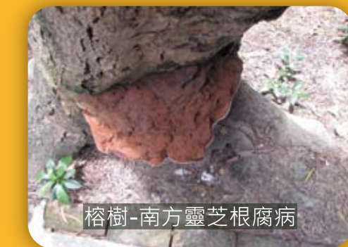
榕樹-南方靈芝根腐病