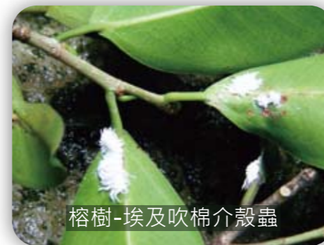
榕樹-埃及吹棉介殼蟲