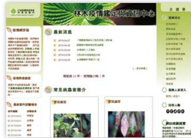
圖一 林木疫情鑑定與資訊中心網首頁

首頁(圖一)劃分為三個區塊，左側區塊為服務網宗旨、服務問卷調查、最新案件診斷報告；中央區塊為最新消息、常見病蟲害簡介、專題報導；右側區塊為主選單。