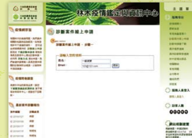
圖二 輸入申請者姓名及E-mail