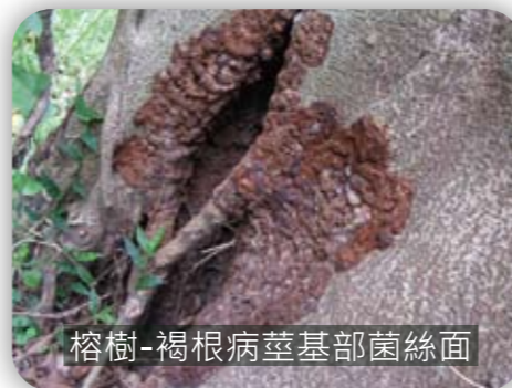
榕樹-褐根病莖基部菌絲面