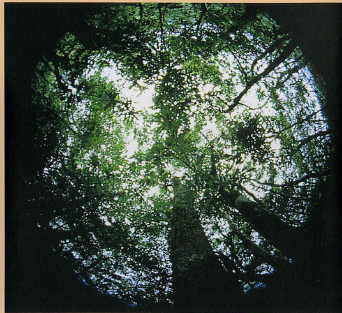
▼台灣北部中低海拔典型之植物社會 -- 天然闊葉林

台灣氣候溫和潮濕，是個適合蛙類生活的棲境。但對於台灣的蛙類，你又了解多少呢？考考你下列四種青蛙，你是否能說出牠們正確的中文俗名及特徵呢？在此我們先賣個關子，欲知正確答案請見下頁或來陳列館參觀吧！