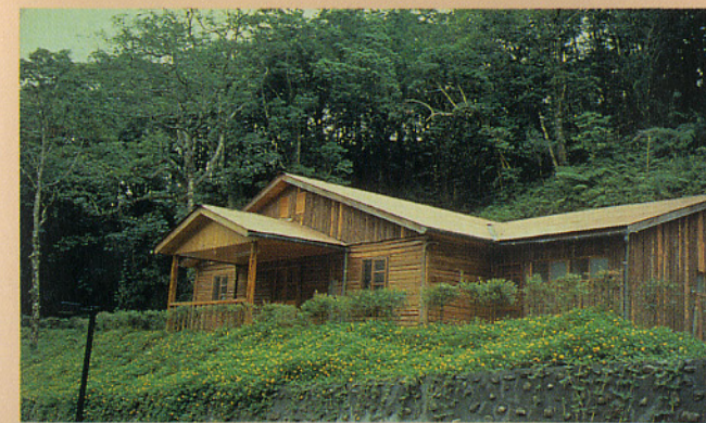
▶小徑木加工利用-利用小徑木建造木屋