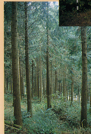
◀台灣杉人工林經營-台灣杉疏伐修枝試驗