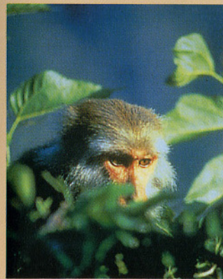
▲台灣特有種生物 -- 台灣獼猴

本展示室介紹有關台灣林業的各項現況，主要項目包括自然環境、森林資源保育、森林經營、林業經濟、環境綠化、森林保護以及林產利用等主題，藉由圖片與文字，簡單扼要說明本島森林資源之特性及重要性。