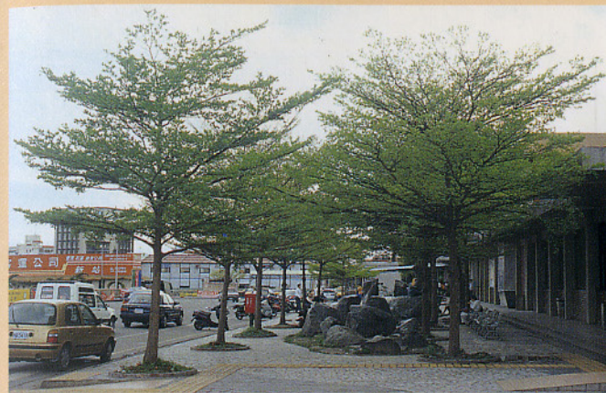
▲藉由綠化樹種之培育、環境綠化之規劃，以及都市林建造等技術之開發，可以減少空氣污染、阻隔噪音、提昇生活品質、美化都市環境，並增加休閒活動場所。