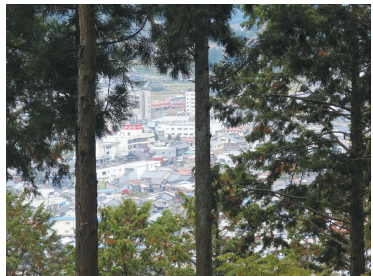
圖2 智頭町為一森林集落

為了重新找回地方的活力，幾位有志的居民開始以活用杉木為主題推行一些活動，並於1988年創立「智頭活化計畫集團」(Chizu Creative Project Team，簡稱CCPT)。CCPT的成員約有30位，其中也有智頭町公所的職員