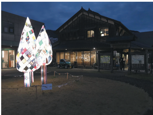
圖1 智頭車站前一景

近年來，日本十分關注都市人口過度集中與地方過疏化的問題，地方過疏化是指因人口減少、高齡人口增加以及財政惡化等因素，造成地方社會活力不足及產業機能低下等之現象。根據日本總務省2022年的統計，全日本1,719個市町村中，總計有820個市町村被列為過疏地區，占比為47.7%。日本政府為達到低碳社會的目標，將森林政策定位為日本未來願景的藍圖。因此，透過各級政府的林產業振興與社會參與運動，來減緩偏鄉與山村人口快速下降的趨勢，活化鄉村區位的社會功能，即為朝向永續發展的重要方向。本文即以智頭町為例(圖1-圖2)，介紹該地區的鄉村活化運動，如何透過適當的制度設計，打造出居民自治的公民參與運動，形塑出以林產業為主體的在地價值，翻轉人口老化與產業衰微的趨勢。其中眾人的投入、不斷的嘗試、邊做邊修、找到集體目標的過程，有許多值得學習之處，特為之文。