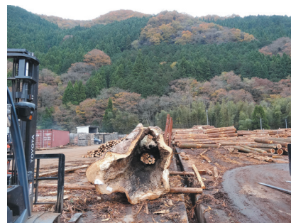
圖4 智頭町的石谷林業木材市場

(lifull home's press編集部，2015)。除推行地方再生外，為了培育地方營造人才，CCPT於1989至1998年間每年辦理「杉下村塾」，邀集專家學者、町公所職員與地方營造的代表，共同針對地方再生活化的各種議題進行討論，並提出可能的對策(片岡，2009、阪野，2016、寺谷等，2019)。廣為人知的「零分之一鄉村活化運動(1/0村おこし運動)」即由此誕生，也自此開啟了智頭町居民自治的第一步。本文將介紹智頭町居民實踐自治的軌跡，看看他們如何面對與調適大環境所帶來的各種挑戰。