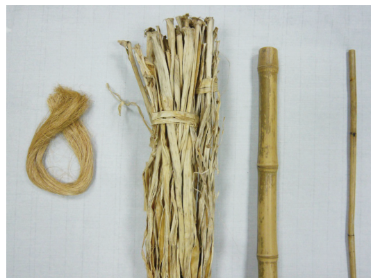
各種手工造紙原料纖維(由左至右：麻、樹皮、竹、藤)。

麻類是最早用造紙之原料，漢代發明紙以來一直到宋代，其使用量一直居領導地位。近代出土之古紙殘片及敦煌石室藏經紙多為麻紙。麻雖為非常好之造紙原料，但由於料源較少，除少數特殊紙外，甚少使用麻紙。除大麻、苧麻外，尚有亞麻、黃麻、麻