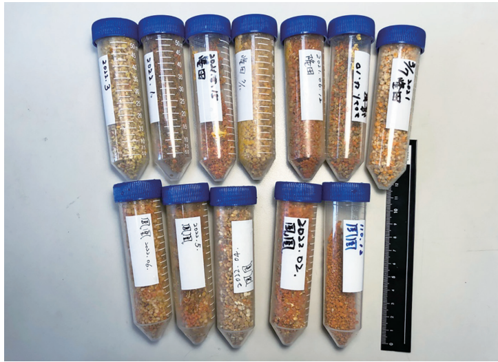
Fig. 1. Samples of pollen grains analyzed in this study exhibit different colors due to variations of plant species.