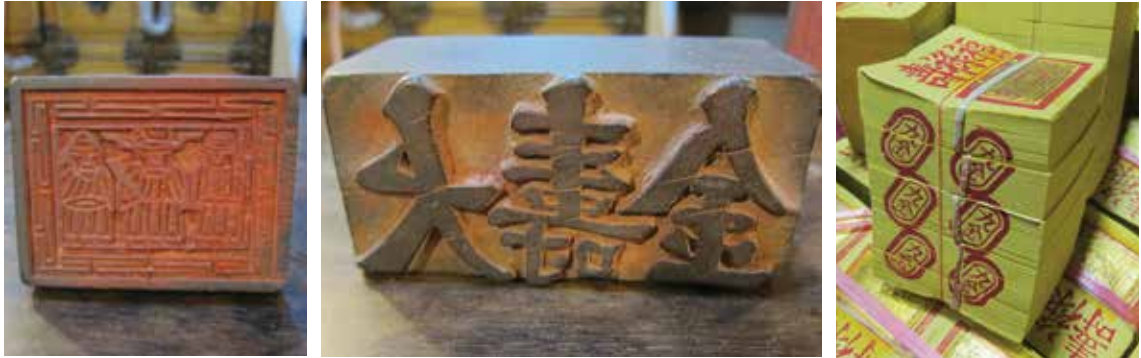
左圖與中圖為宗教用紙所使用木刻版畫，會刻上多種神明圖案，並在成疊竹紙側邊蓋上不同圖案或文字的紅印，以示區別

煮兩種，蒸煮法必須經過半個月以上與石灰與草木灰的反覆蒸煮，相當耗費人力，通常用於製做高品質的竹漿；而沒有經過蒸煮程序的竹子只用石灰水浸泡堆置而自然發酵，這種製法會存有較多的木質素，所以多用在製作原色或品質較低的紙張，如衛生紙、包裝紙等。不需蒸煮的製紙法操作簡單，耗用材料只有石灰，生產成本低，相當適合作為農村的副業進行持續的生產。綠色竹子在經過浸泡及蒸煮，當葉綠素被破壞後，竹漿便呈現天然的黃棕色，也就是我們一般所見紙錢的顏色。