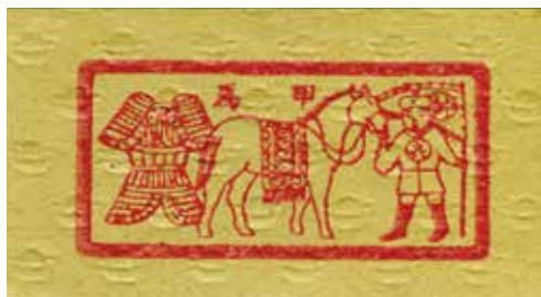
左圖是給亡靈的換洗衣物、梳子及剪刀等民生用具，右圖是給天兵天將的馬匹及盔甲

臺灣早期所印的外方紙，紙質相當粗糙，但圖案線條較為活潑，隨著時代演變與簡化，目前大約只剩40種左右。