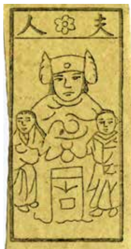
左圖稱為天官用來求神明賜福，右圖稱為夫人，用來請神明前來照顧小孩

臺灣手工竹紙製作工廠在面臨日漸昂貴的人工及成本，就和其他的傳統產業一樣，必須轉往人工便宜的地方生產，所以現在宗教用所需的竹紙都已從中國及東南亞地區進口，到臺灣後再進行加工、印刷及包裝。