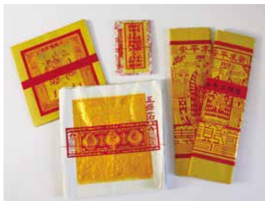
常見傳統手工製作金紙

隨後中國歷經改朝換代，明朝末年鄭成功帶著戰敗的末代皇帝退到臺南，大量中國沿海居民亦跟隨前來墾殖。此時臺灣約有20萬人口，紙張需求日增，且必須由上述福建產紙城市供應，並由海路運來。此期人民為感謝天上神佛的庇佑，經常舉辦祭神儀式祈求平安，祛除瘟神疾病。於是用竹子為架構，以紙糊船身，祭祀完畢後將船與大量金銀紙放至河邊焚燒。臺灣人相信藉著這樣的儀式可以讓神鬼收到祂們的生活必需品，不致危害人間。這種形式的祭祀方式是源自福