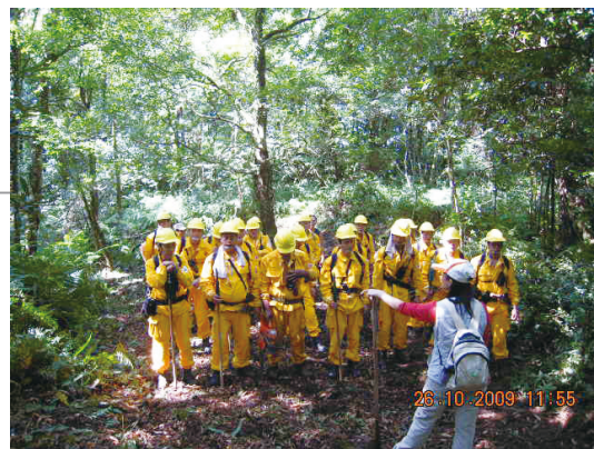
應用森林火災緊急應變指揮系統指揮救火隊演練。

進入中興大學森林系三年級，再續森林緣分。我經常比喻自己像足了由塑膠袋育苗成功的換床苗木，老天爺將我安排在森林服務，於是到了中興大學森林系，這個守護森林的優質苗圃接受更專業的培育，健化然後成長茁壯。