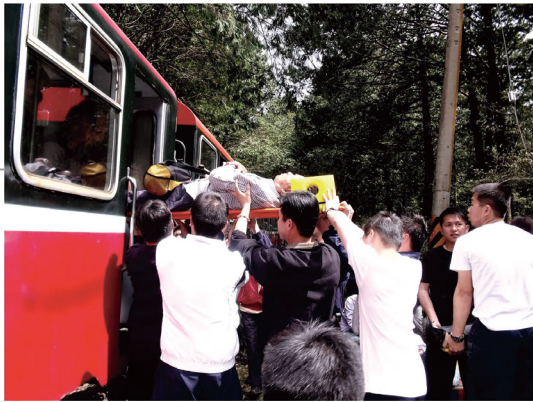
0427阿里山森林火車翻覆事故。