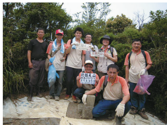
與同仁偏遠巡護。

的付出，對於女性在林業有關部門的服務，經過30年體驗後，歸納了以下幾項心得，特別在這裡提列出來，提供大家參考：