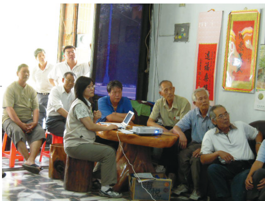
透過里長邀集林農輔導違規暨政策宣導。