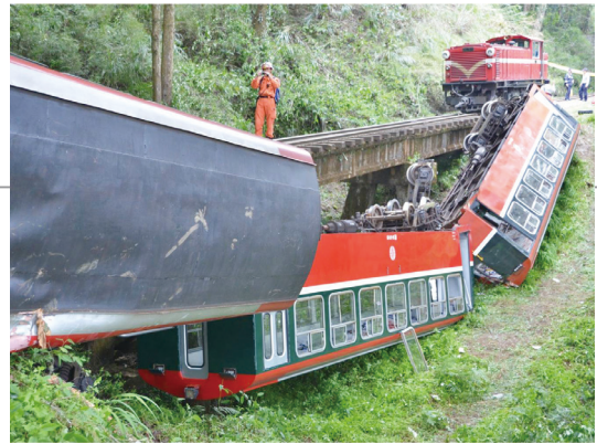
0427的搶救過程。

民班課程，無非就是想多了解原住民的傳統慣俗與想法，日後在面對原住民朋友時有更多的同理心，對業務推展也有所助益。雖然基層第一線工作的付出，有時候依然擋不住政治的影響，政策的不定與無法持續引發我的另一個鬥志，是該深入瞭解公共行政的運作；在傳統森林經營中，可能的牽絆，於是，我開始利用週末公餘時間，前進臺北大學公行所先修課程，前後近三年，順利取得在職專班的碩士學位。