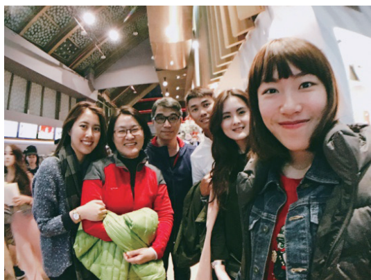
支持我的家人們。