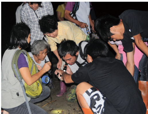
滿州港口社區陸蟹解說戶外教學。