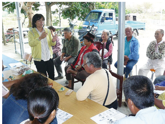
恆春水蛙窟部落討論會議。

並可結合傳統一、二級產業豐富遊程，在此基礎下發展社會企業(Social Enterprise)。