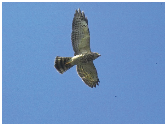
里德賞鷹—灰面鵟鷹。

落發展生態旅遊，由輔導團隊陪伴一年半，讓山村居民將先民留下的文化資產以及山林中的自然生態轉化為生態旅遊資源，並從原來獵殺鼯鼠轉為保護，而成為臺灣觀賞鼯鼠生態的最佳景點。2012年林務局選定嘉義縣鰲鼓濕地森林園區周邊部落，由輔導團隊陪伴三年，建立起村民組成的解說團隊，再結合休閒魚塢、餐廳與社區巡禮等形成生態旅遊策略聯盟，同時實施單一服務窗口、環境保育與社區公益回饋制度、無償監測指標物種、無償巡守濕地環境等生態旅遊深層架構的操作內容，是臺灣較為全方位展現生態旅遊理念與實務的社區型生態旅遊地。