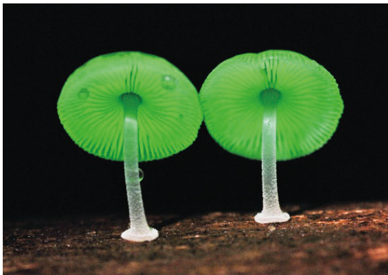
社頂部落梅花鹿尋蹤與夜間生態(螢光蕈)。