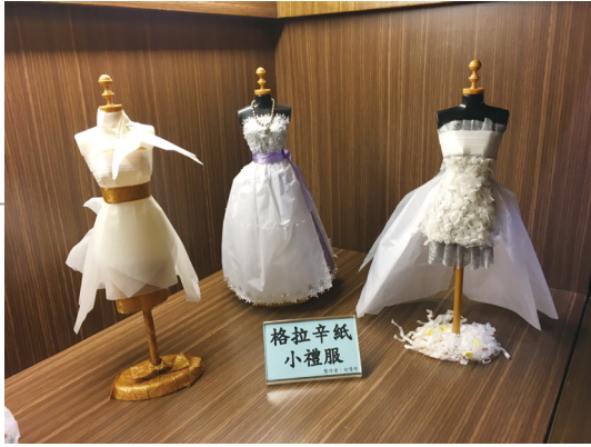
利用竹纖維格拉辛紙製作文創小物—小禮服。 (何慧彤 製作)