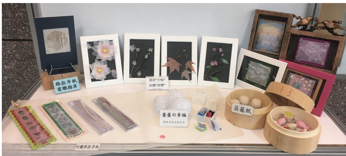
利用竹纖格拉辛紙製作文創小物。

創意等元素結合，將可發展出極具科技及文化創意價值的特色商品。未來的經濟是體驗經濟，文創產業正是體驗經濟的高附加價值代表，故將來能否提供更具「創新與科技化」的商務服務，將成為文創產業競爭力的來源。再者，為提升文創產品優勢或創造性的品牌意象，進而創造競爭優勢。在產品設計前，探索使用者之潛在需求，從中挖掘創新概念並滿足消費者的需求，成為創新產品於設計時亟需探討的課題。