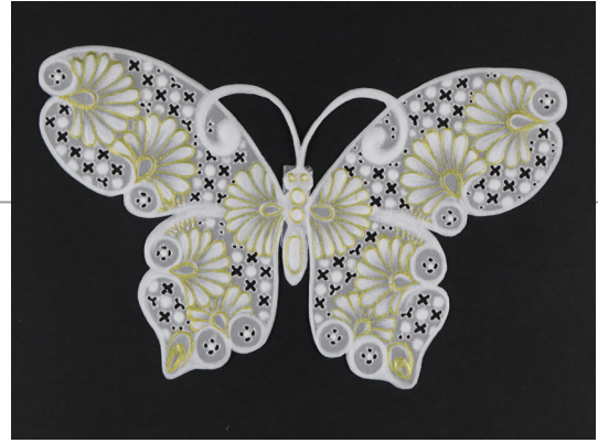
紙繡作品—彩蝶翩翩。(中華紙繡協會駱傳華 製作/ 袁黃駿 攝)

皂」，強調「紙溶你手」，既環保又便利。由於目前消費市場一般紙香皂多使用化學合成香精為主，本所研發的紙香皂為木竹纖維所製成，是貨真價實的「紙」香皂。而臺灣杉葉片及山胡椒果實萃取的兩種精油都具有抗菌的功用，尤其山胡椒果實還有抗發炎的功能。